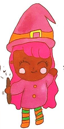
Yara Rubriques jeux et divertissements