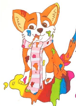
Daisy Rubriques bricos et création