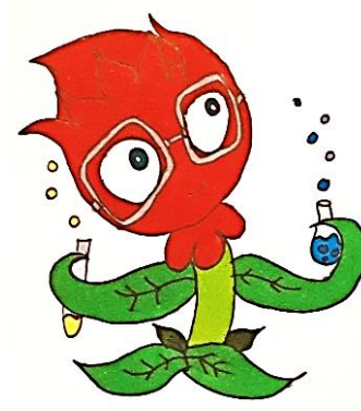
Herman Rubriques scientifiques