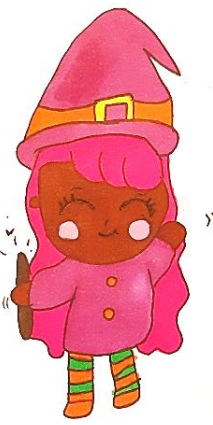
Yara Rubriques jeux et divertissements