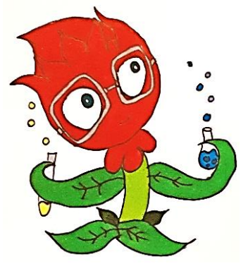
Herman Rubriques scientifiques

Le nouveau Petit Vieusseux Illustré devient le journal de « (dé-)confinement » de la Maison de Quartier !