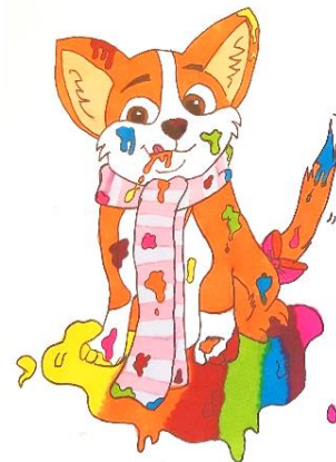
Daisy Rubriques bricos et création