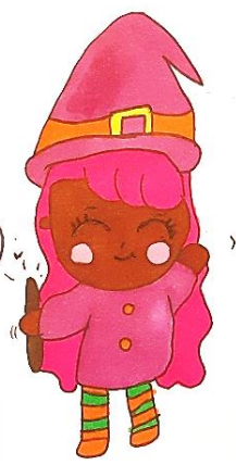
Yara Rubriques jeux et divertissements